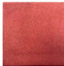
طرح ساده قرمز ۴۰×۴۰×۶ سانتی‌متر