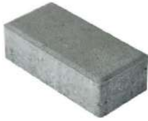
طرح ساده طوسی ۲۰×۱۰×۶ سانتی‌متر