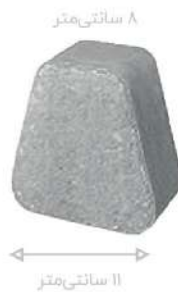
طرح نوستالیت طوسی