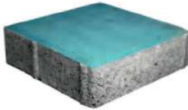
طرح ساده آبی ۲۰×۲۰×۶ سانتی‌متر