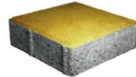
طرح ساده زرد ۲۰×۲۰×۶ سانتی‌متر