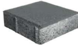
طرح ساده طوسی ۲۰×۲۰×۶ سانتی‌متر