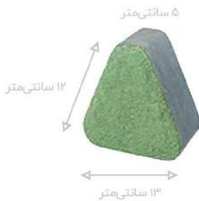
طرح نوستالیت سبز