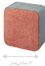
طرح نوستالیت قرمز