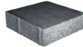
طرح ساده مشکی ۲۰×۲۰×۶ سانتی‌متر