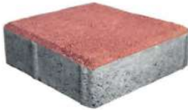
طرح ساده قرمز ۲۰×۲۰×۶ سانتی‌متر