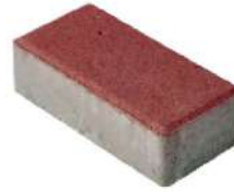
طرح ساده قرمز ۲۰×۱۰×۶ سانتی‌متر