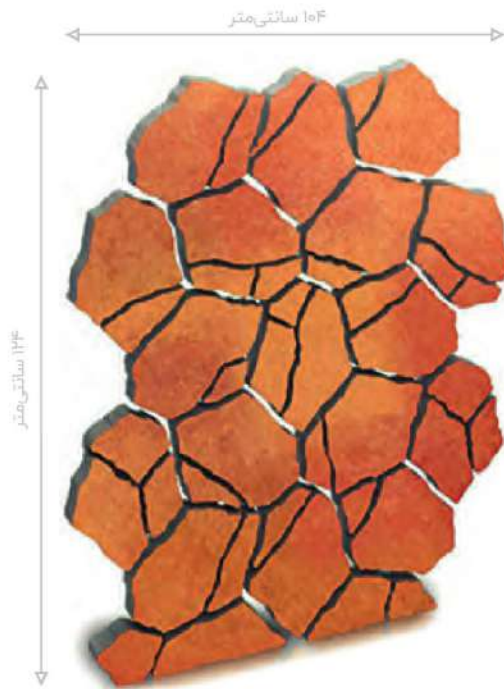
کفیوش بتنی طرح ساسو