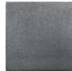
طرح ساده طوسی ۴۰×۴۰×۶ سانتی‌متر