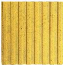
طرح ناپینان ۴۰×۴۰×۶ سانتی‌متر