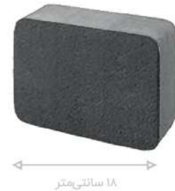
طرح نوستالیت مشکی