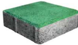
طرح ساده سبز ۲۰×۲۰×۶ سانتی‌متر