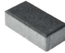
طرح ساده مشکی ۲۰×۱۰×۶ سانتی‌متر