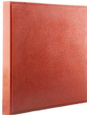
طرح پوست ماری قرمز