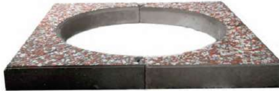
طرح پوست ماری طر