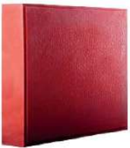
طرح پوست ماری قرمز ۲۰×۲۰ سانتی‌متر