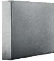
طرح پوست ماری طوسی ۲۰×۲۰ سانتی‌متر