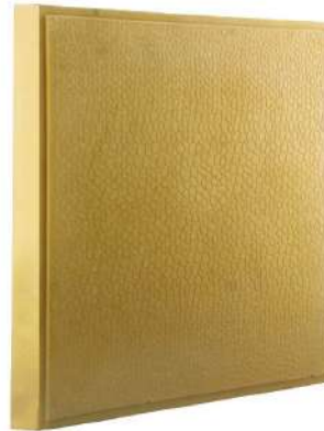
طرح پوست ماری زرد