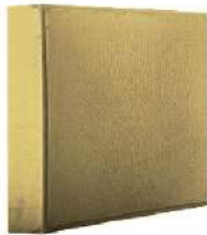
طرح پوست ماری زرد ۲۰×۲۰ سانتی‌متر